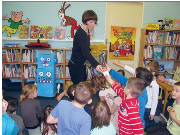
TÝDEN prvňáčků v pobočce Knihovny města Ostravy v ulici Daliborově.

Výtvarná dílna: tvoříme technikou frotáže ostravské motivy. Akce se koná v rámci projektu